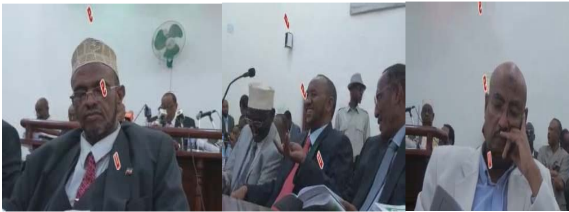
Saddexdi Xisbi: Qolo iska sheekaysatey iyo qolo hurdo miciin biday.

Kala shaandheyn iyo falanqeyn dheer dabadeed, waxaanu guddi ahaan qornay in ka mid ah nuxurka ay xambaarsaneyd khudbadii madaxweynaha mudane Axmed Maxamed Maxamuud "Siilaanyo".Halkana waxaanu ku soo bandhigaynaa intii ka hadhsaneyd khudbadii madaxweynaha oo dheerayd sida uu tilmaamayo muuqaalka sawiradan.